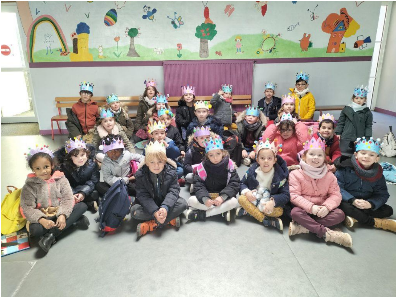
Deiz ha blez George -Miz Genver