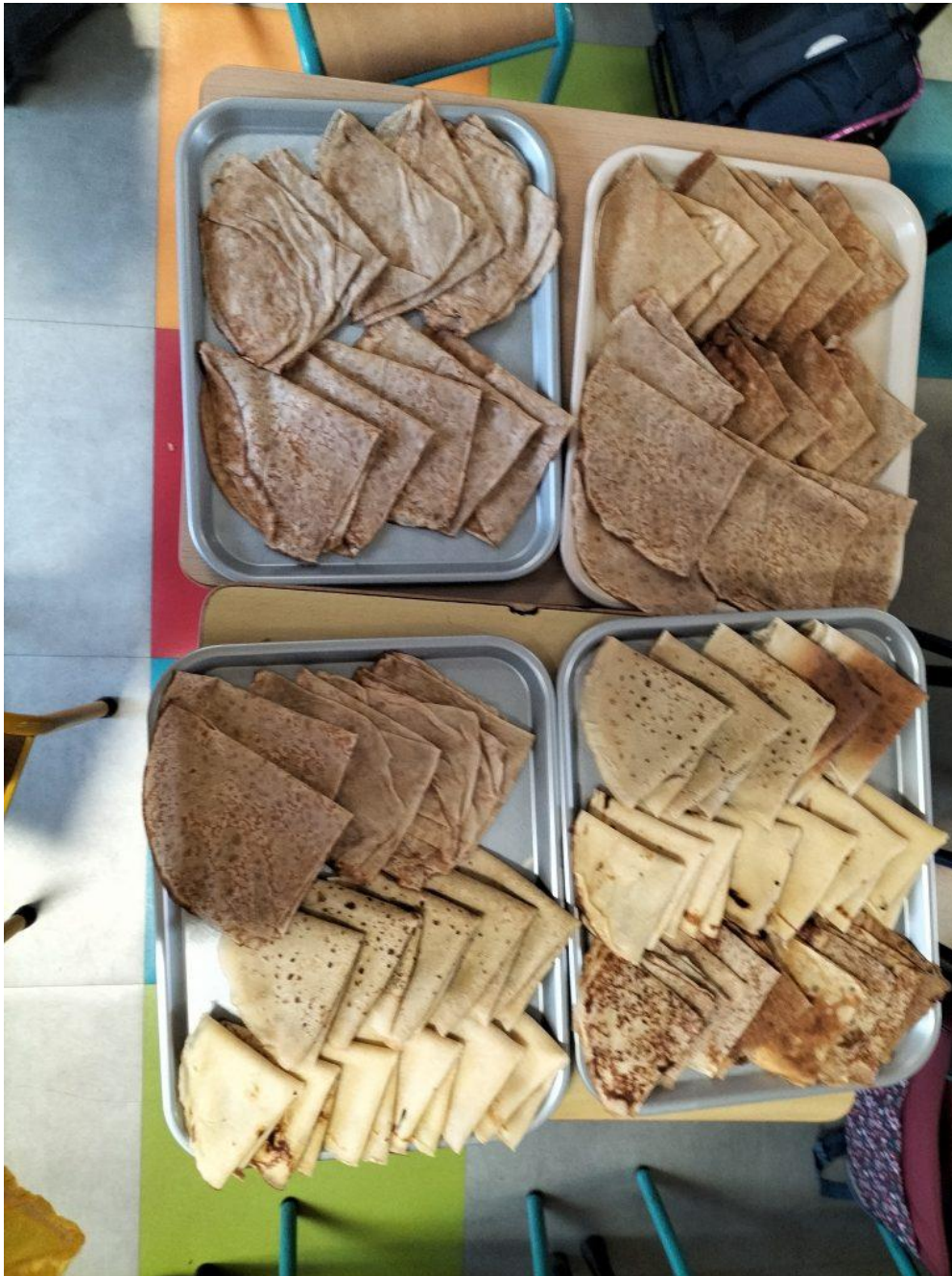
Poull neuial abadenn N°2

Ar strolladoù a zo bet graet. Pep hini a ya war-raok hervez e live.