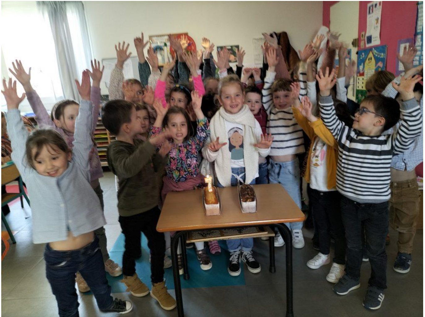
Dansoù breizh gant Arwenn

Dizoloet hon eus dansoù disheñvel war lerc'h teir abadenn hepken :