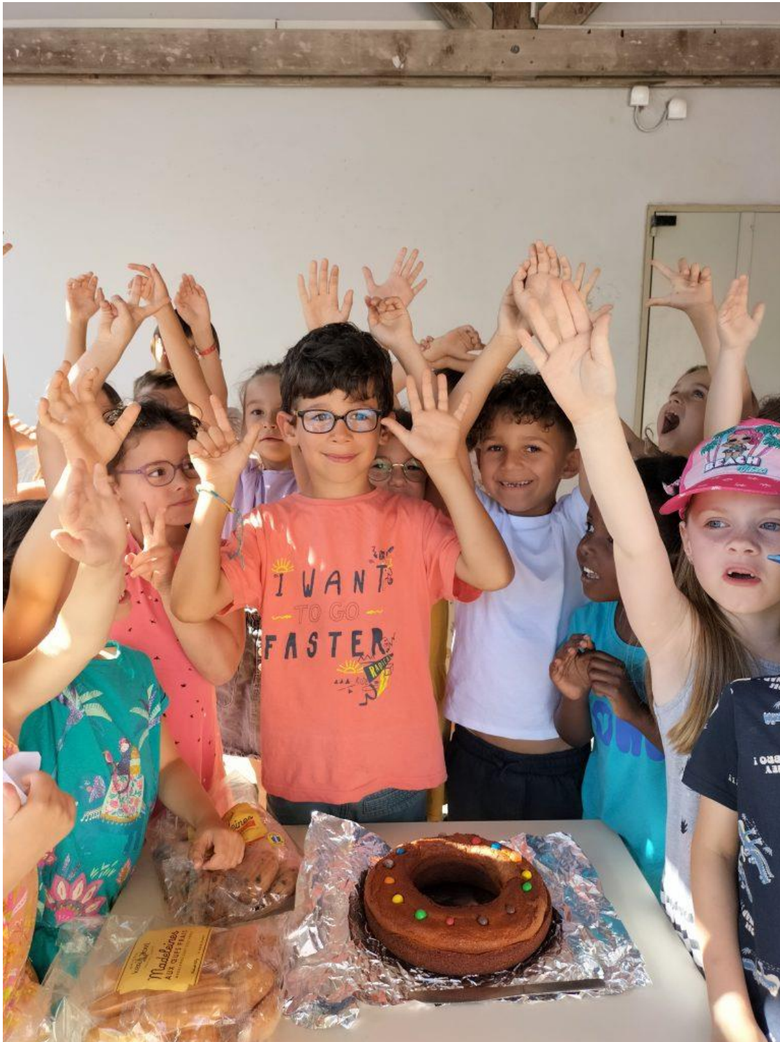
Sortie scolaire à l'île Kerner Riantec

Les élèves ont pu découvrir la maison de l'île Kerner, ancienne maison d'ostréiculteur, transformée en musée. Ce musée propose une découverte de la petite mer de Gâvres, site riche en faune et en flore.