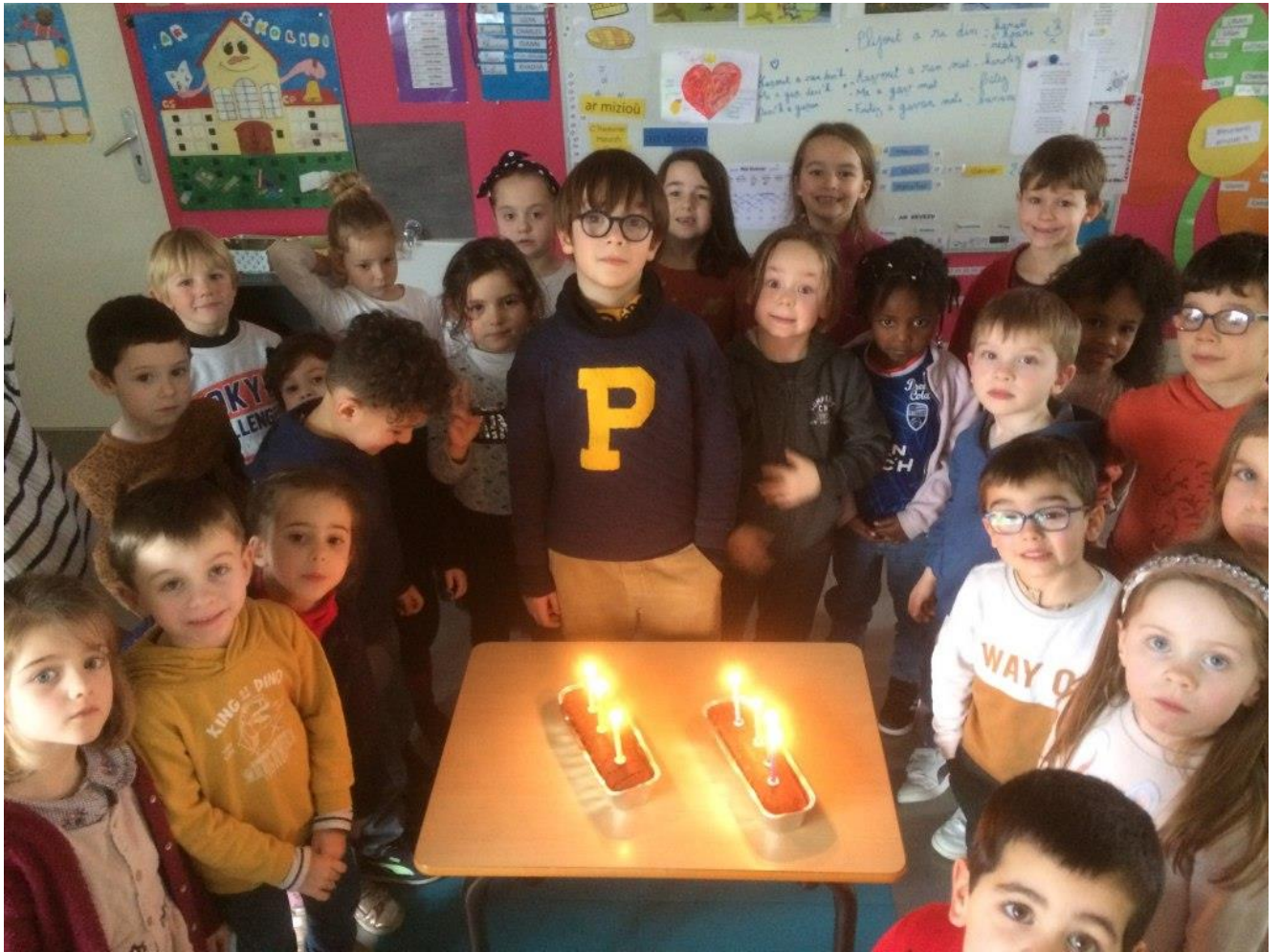
Nedeleg laouen d'an holl !