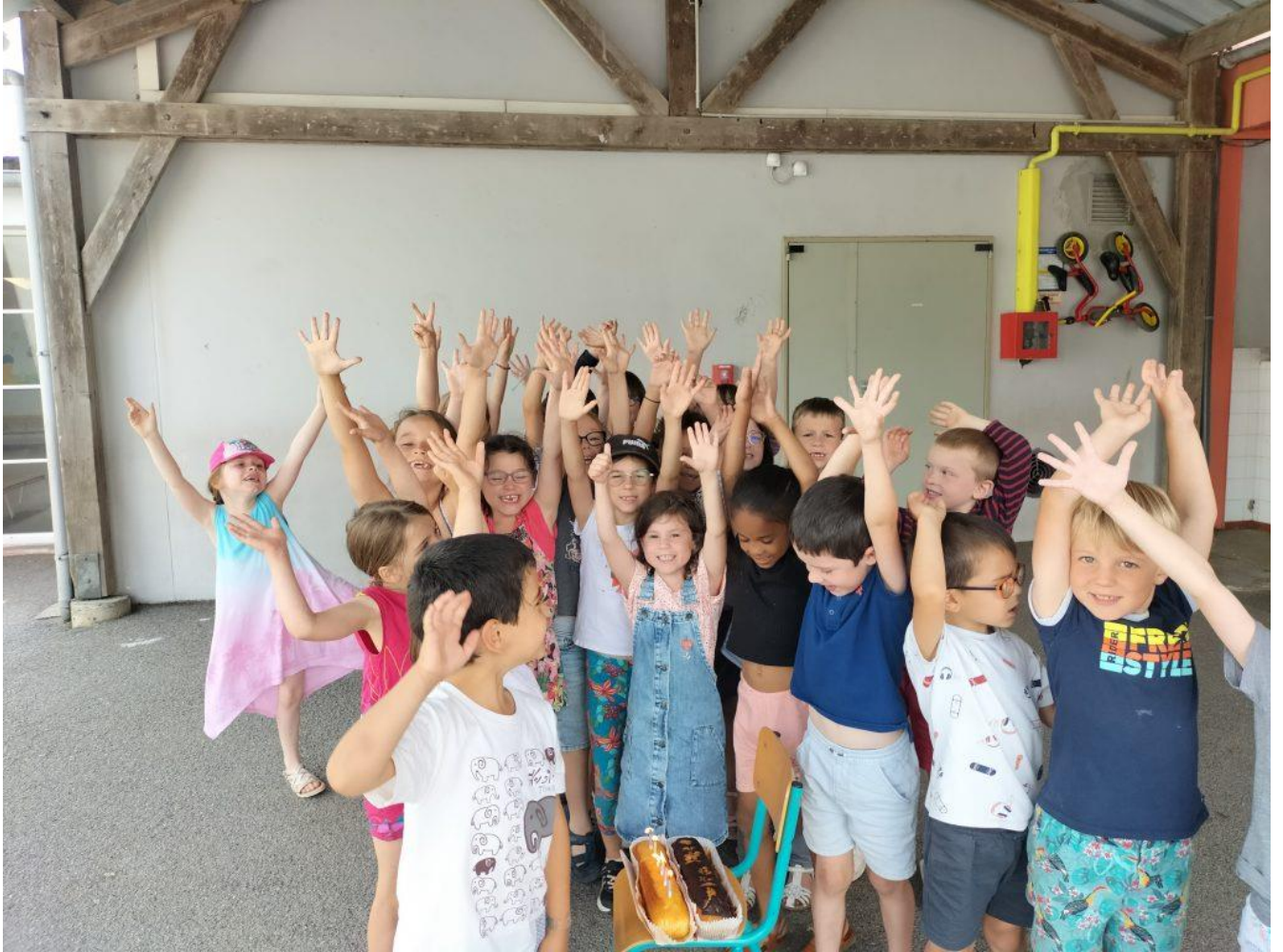
Abadenn ziwezhañ gant Arwenn – dansoù Breizh