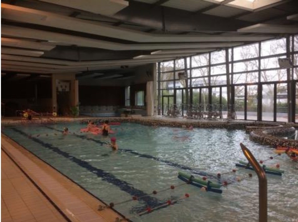
Dansoù breizh gant Arwenn